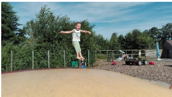
Groetjes van de Bosuilen.

Het was weer een top zomervakantie. Nu gaan we bezig met het thema welkom. Er wordt veel buiten gespeeld en als het kan hebben we een waterfestijn op het plein.